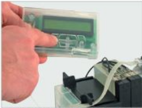
zdejmowalny display tekstowy