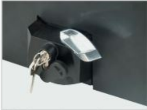
odryglowanie awaryjne ze znormalizowaną wkładką patentową